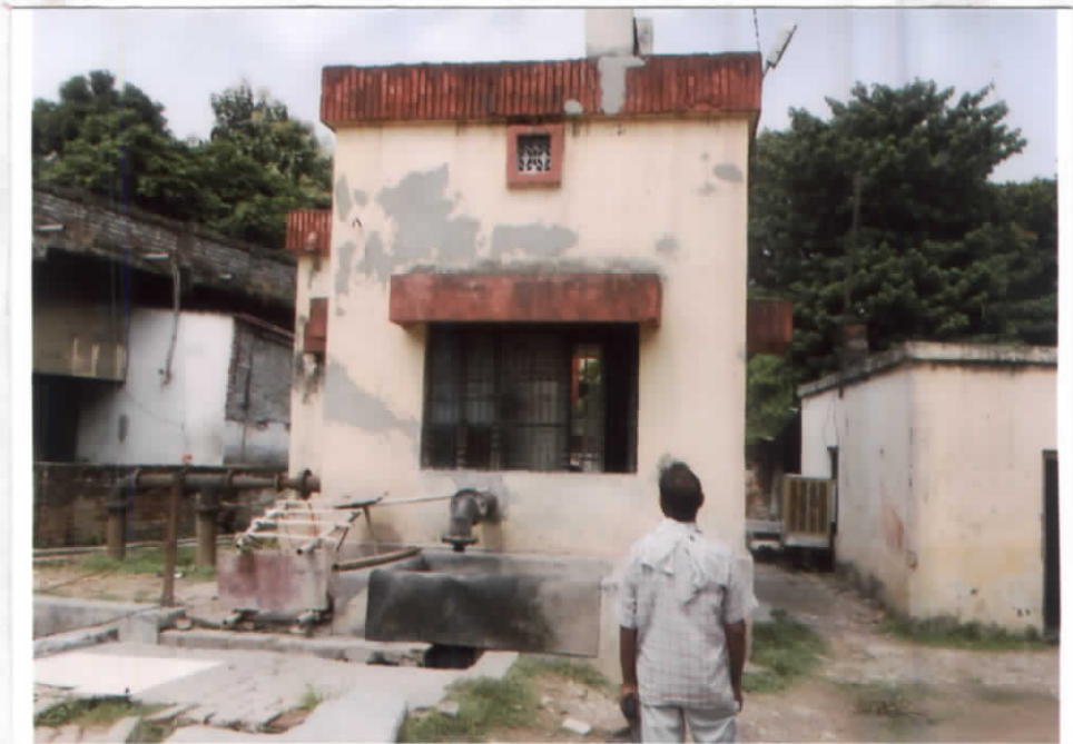
फायरविण्डो मल्लरूप का भाङ्गमल'फायर'